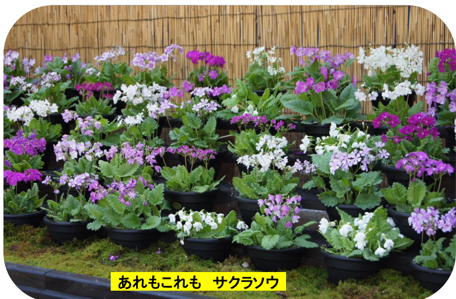
あれもこれも サクラソウ