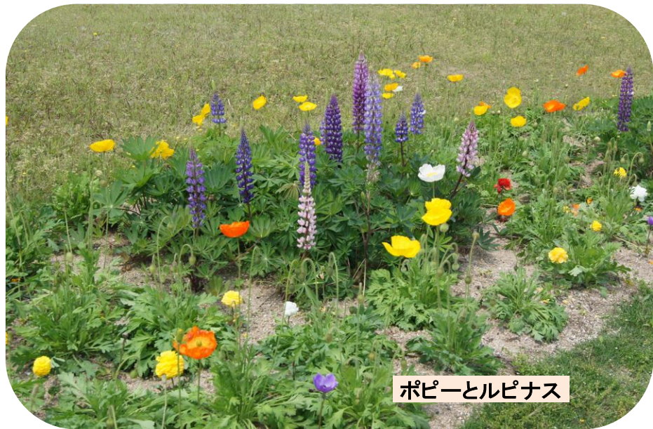
ポピーとルピナス