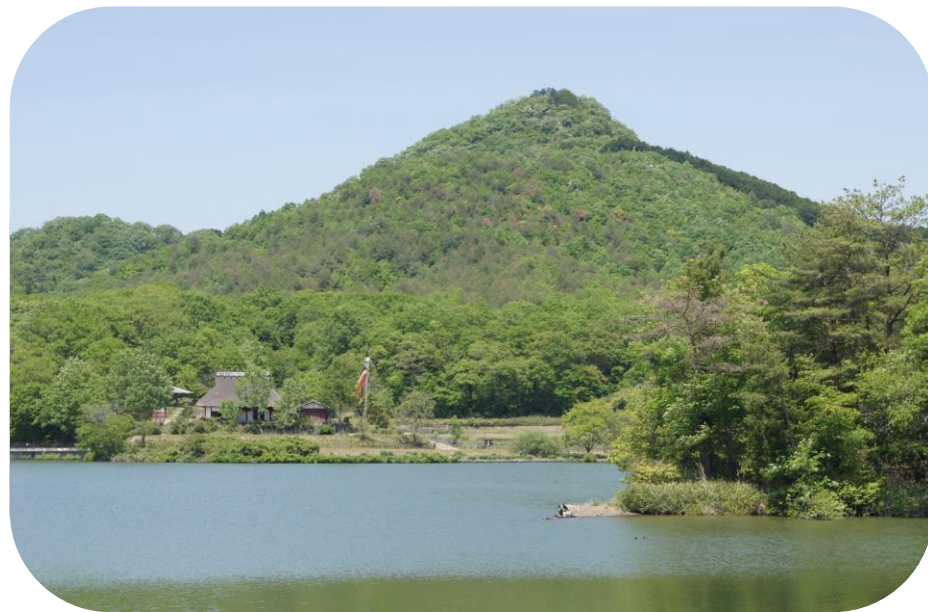
いつもきれいな有馬富士と福島池