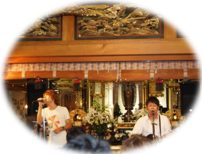
志方町廣尾 円照寺