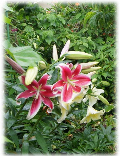
志方町廣尾 円照寺