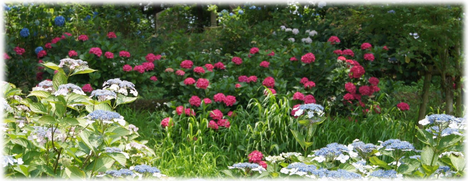
浄土寺 紫陽花 散策路