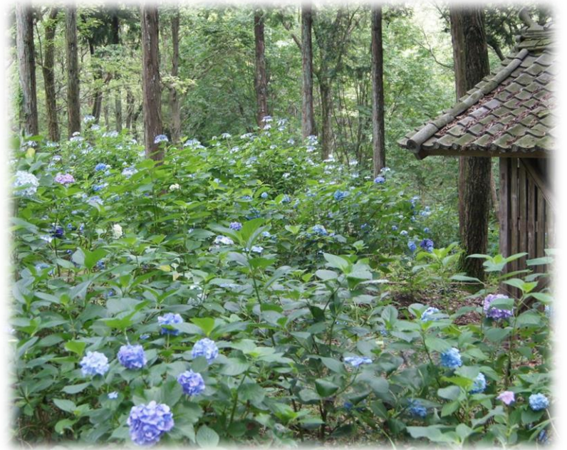
淨土寺 紫陽花 散策路