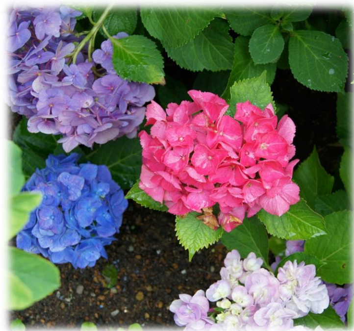
志方町廣尾 円照寺