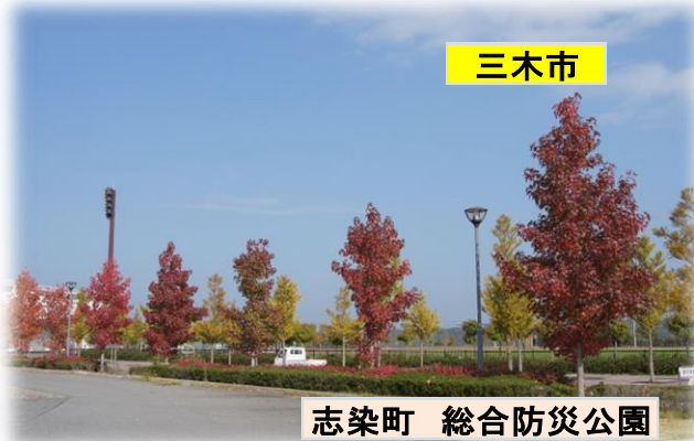
志染町 総合防災公園