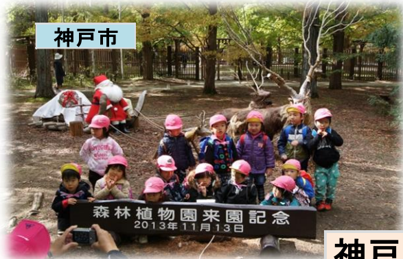
神戸市立森林植物園