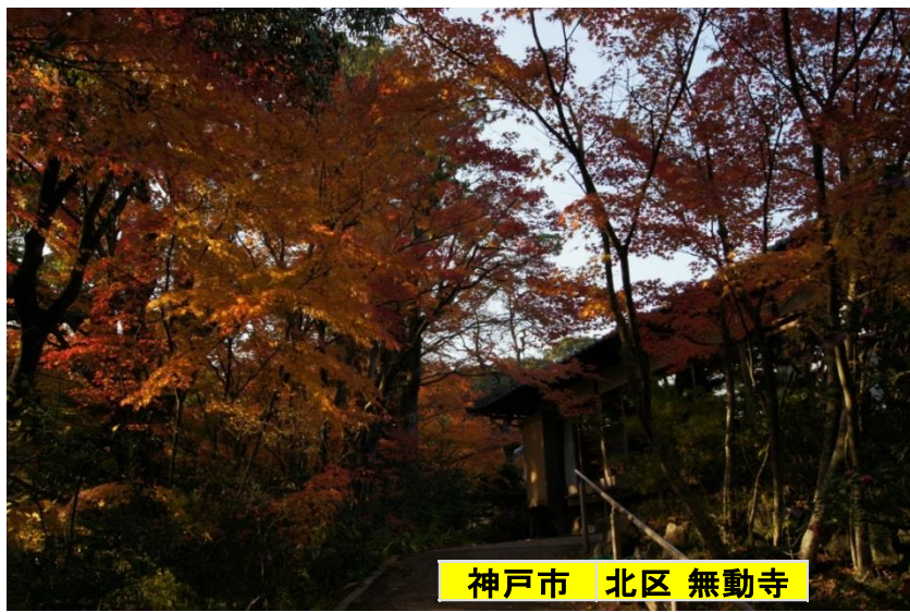
神戸市 北区 無動寺