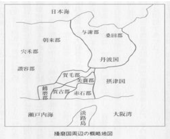
播磨国周辺の概略地図

ある日、来目尊と吾田考を伴てくまをとりて、場所を美囊川に細目川が交わる辺りにある、来目尊の館から最も近い場所最初に暮らす赤石郡海部御幡の村大にたどり着いた。ここは少し大石の谷が沢山、酒好きの大石尊と吾田考が又も飲んで馬鹿騒ぎをしてしまった。 縮見村の生活を慣れくると色々なことが見えてくる。忍海部の鉄鍛冶のおかげで農器や加工道具にのびて稲作と家屋の建築が盛んに行われ、部屋が増加し、危機を脱して認識した億計王と弘計王は吉備、赤石、萬城の忍海を行き果す所、吉備の旅行は美囊川が聖域の舟で縮見川を流れて、赤石の忍海部に出る