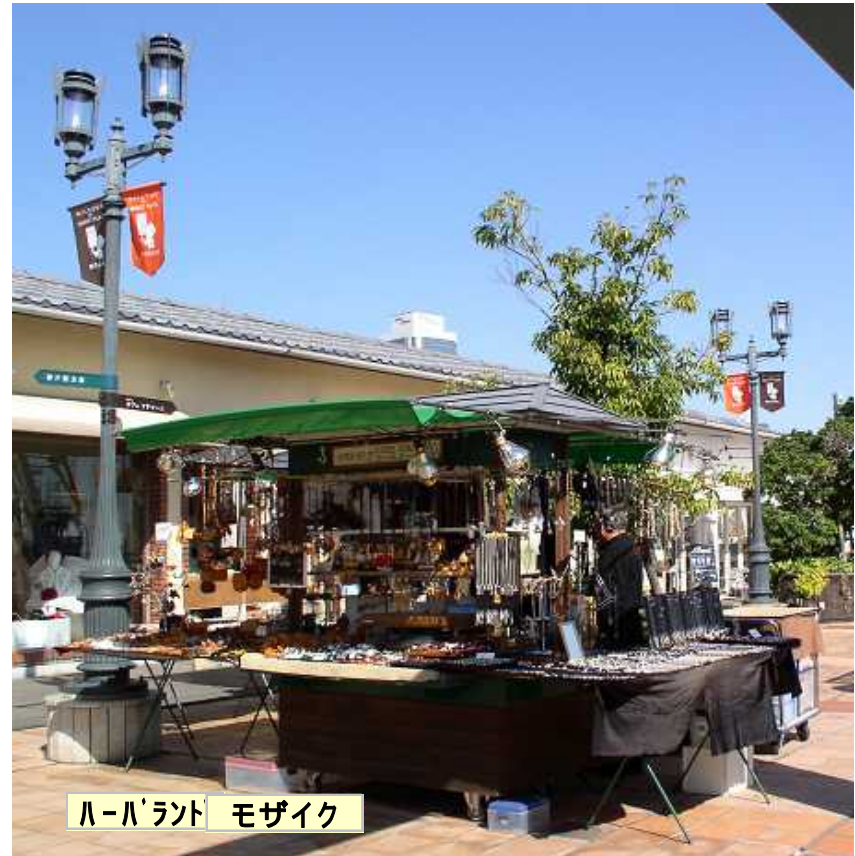
ハーバランド モザイク