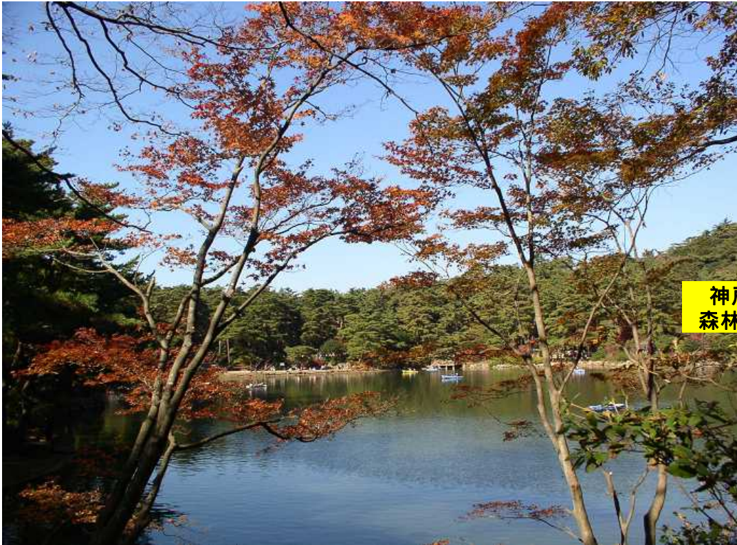
神戸市立 森林植物園