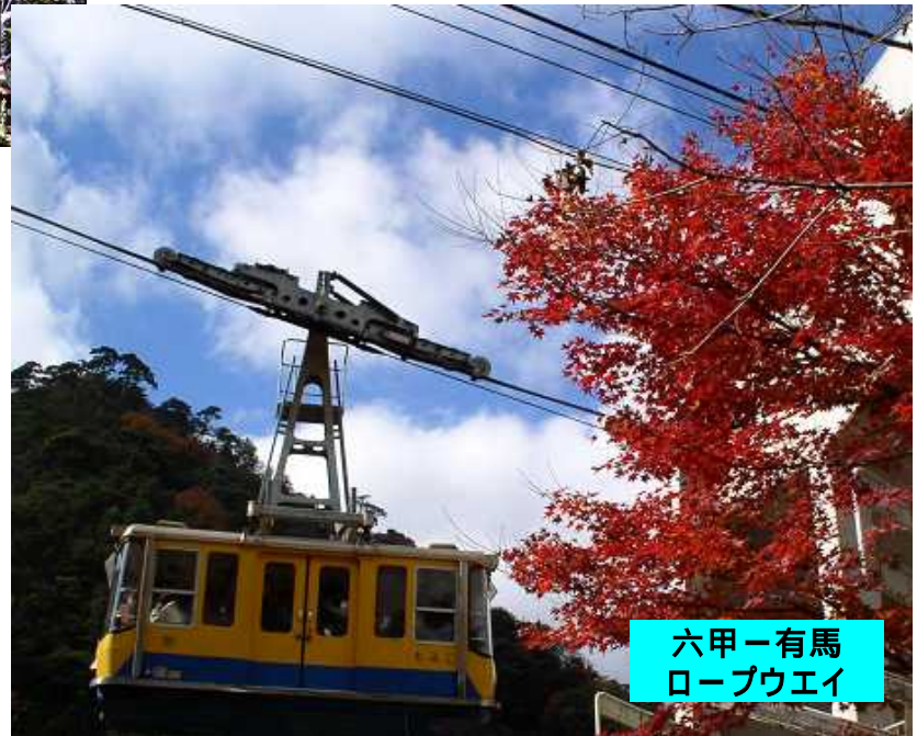
六甲ー有馬 ロープウェイ