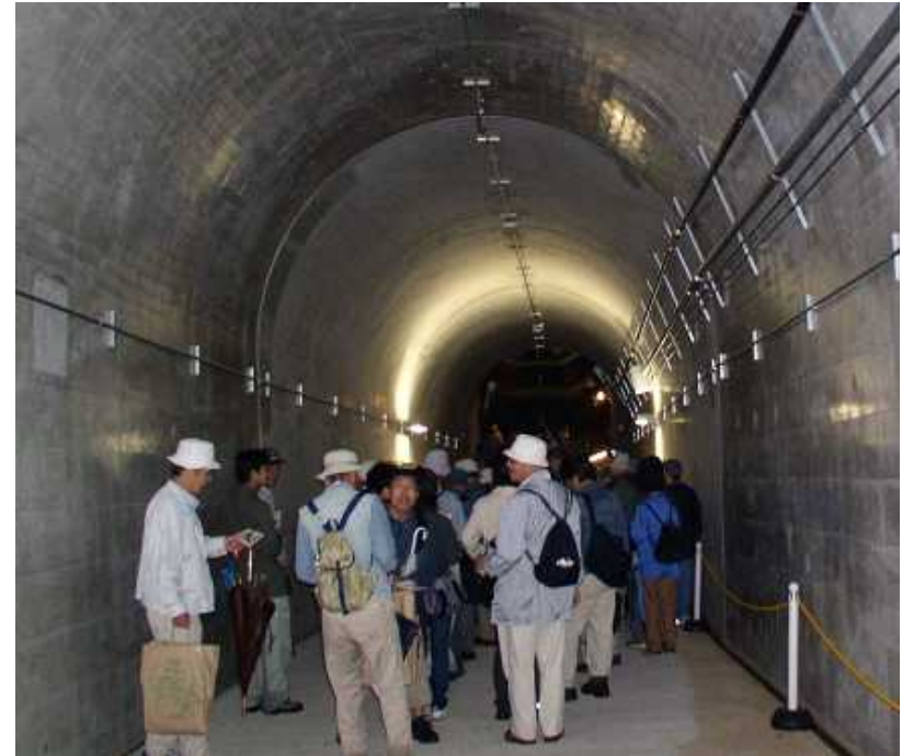
トンネル(隋道) 会下山公園の下を通る