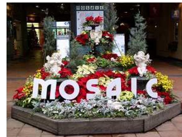
メリケンパーク・ホテル