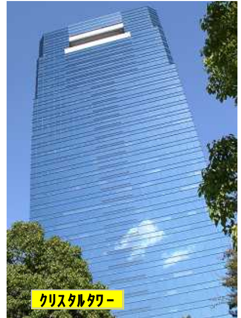
クリスタルタワー