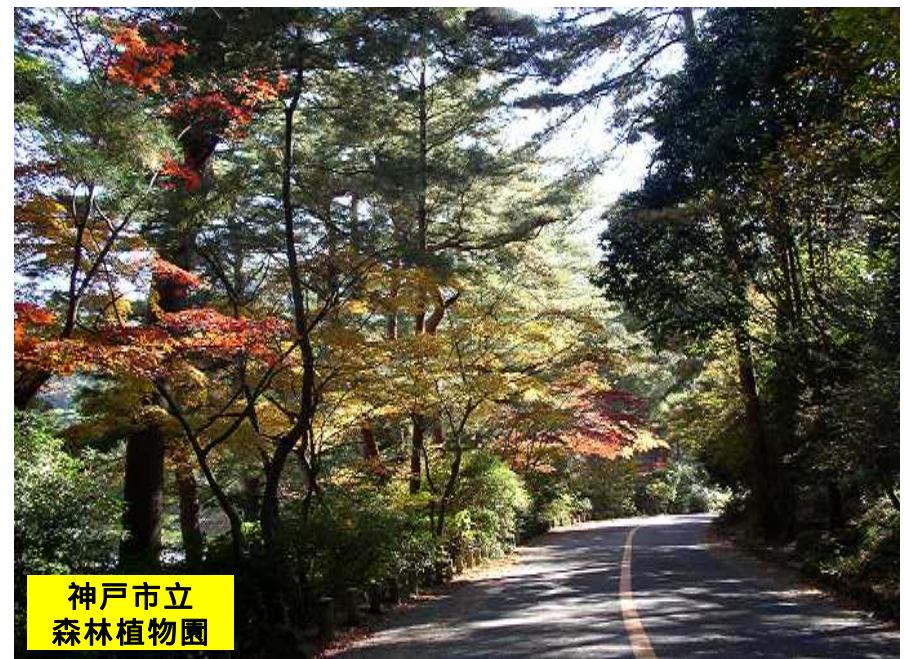
神戸市立 森林植物園