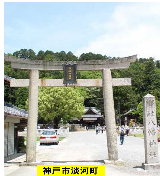
神戸市淡河町 六條八幡