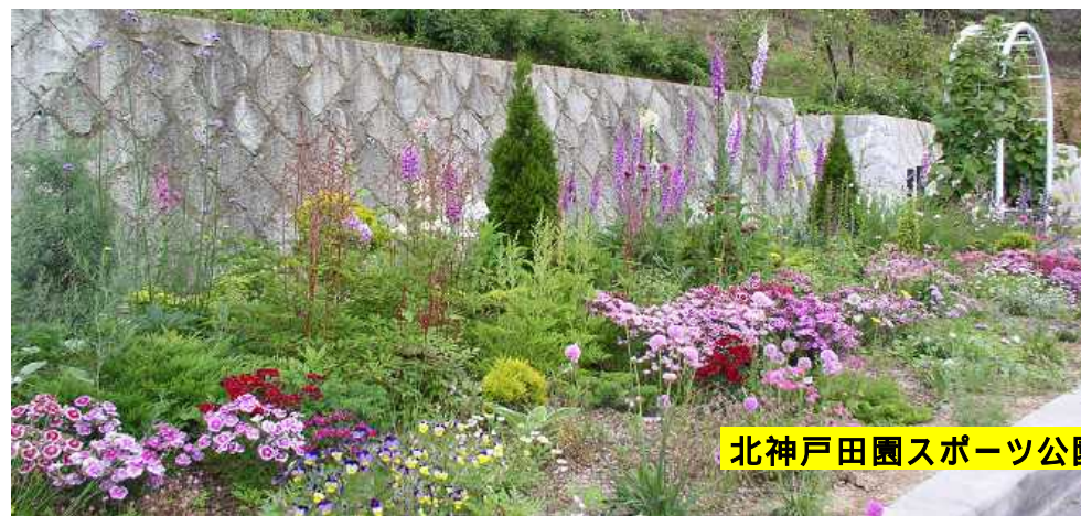
北神戸田園スポーツ公園