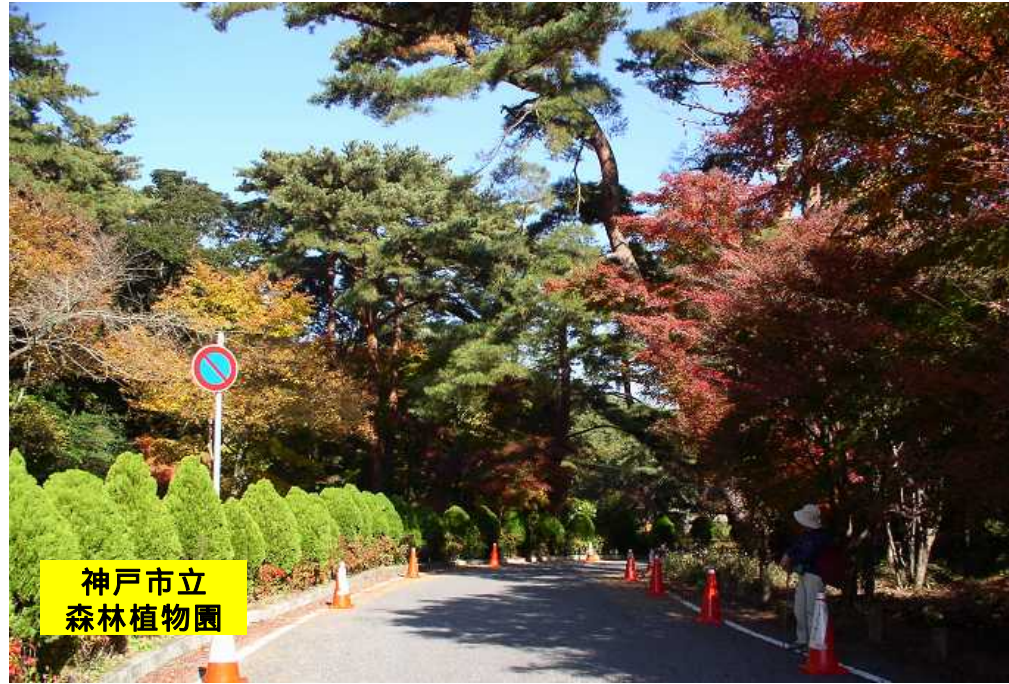
神戸市立 森林植物園