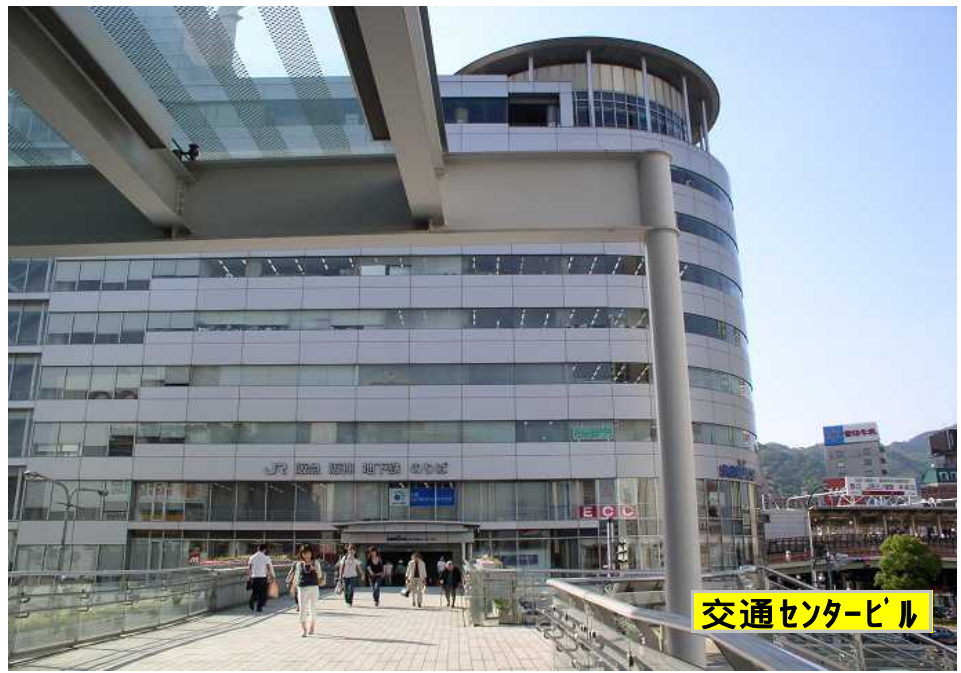
交通センタービル