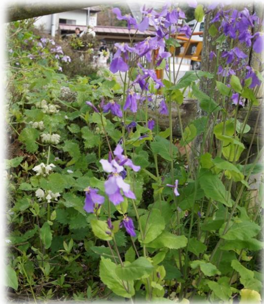
ショカツサイ・オオアラセイトウ