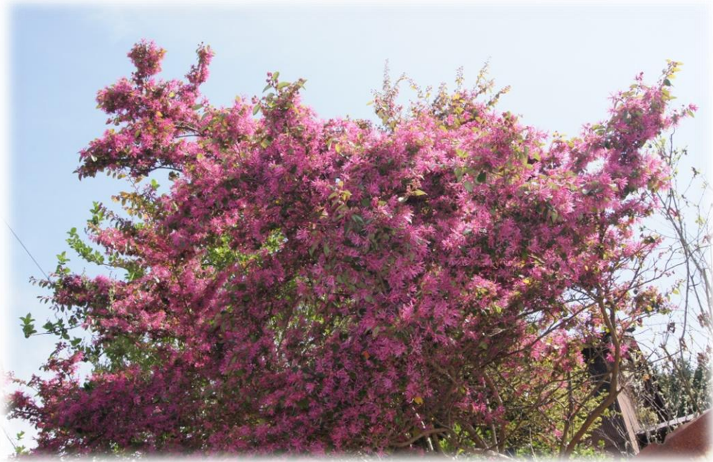
ベニバナトキワマンサク