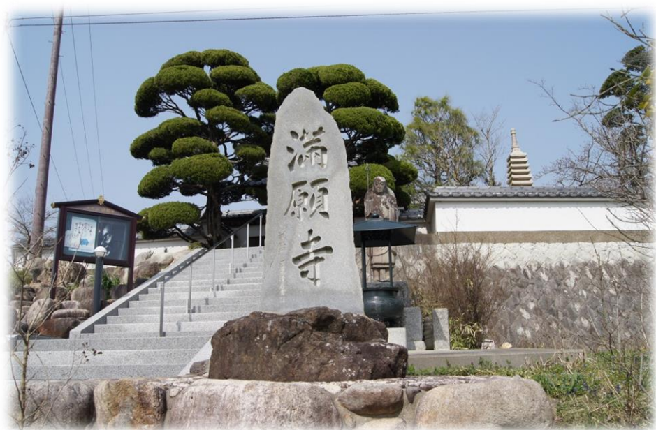
三木市志染町三津田 万願寺