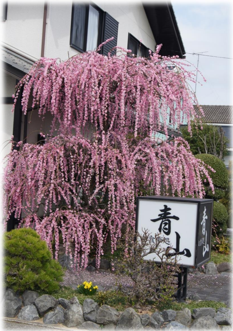
近所のしだれ梅 素晴らしい