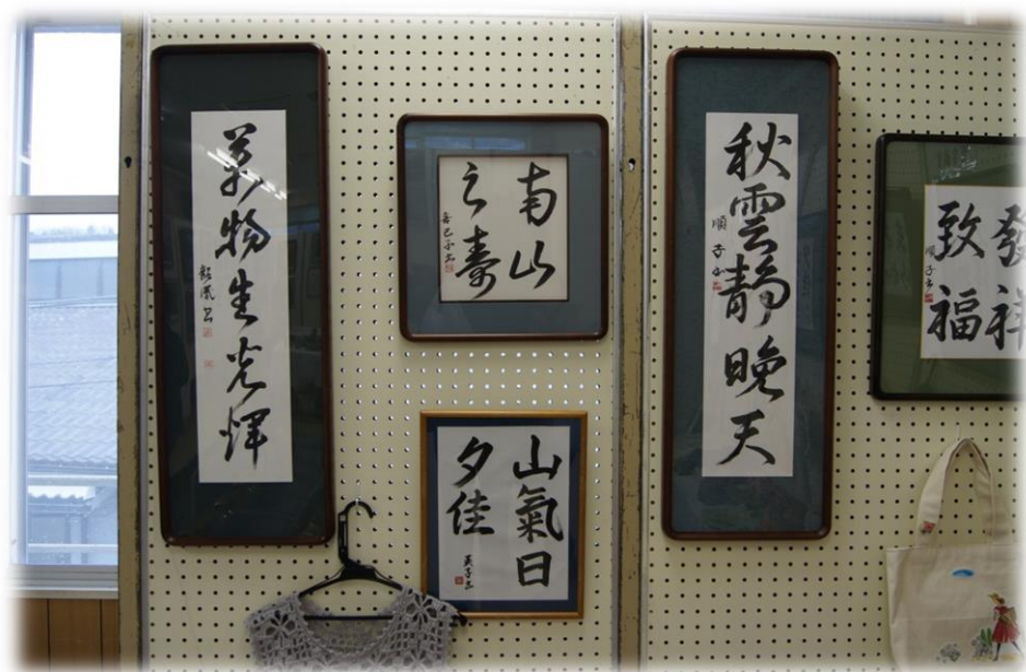
志染町公民館 文化祭