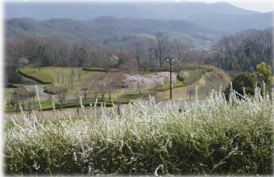
総合防災公園枝垂れ桜