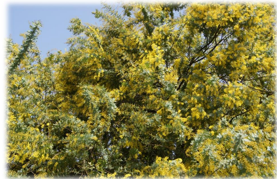
雌岡山 付近の フサアカシア