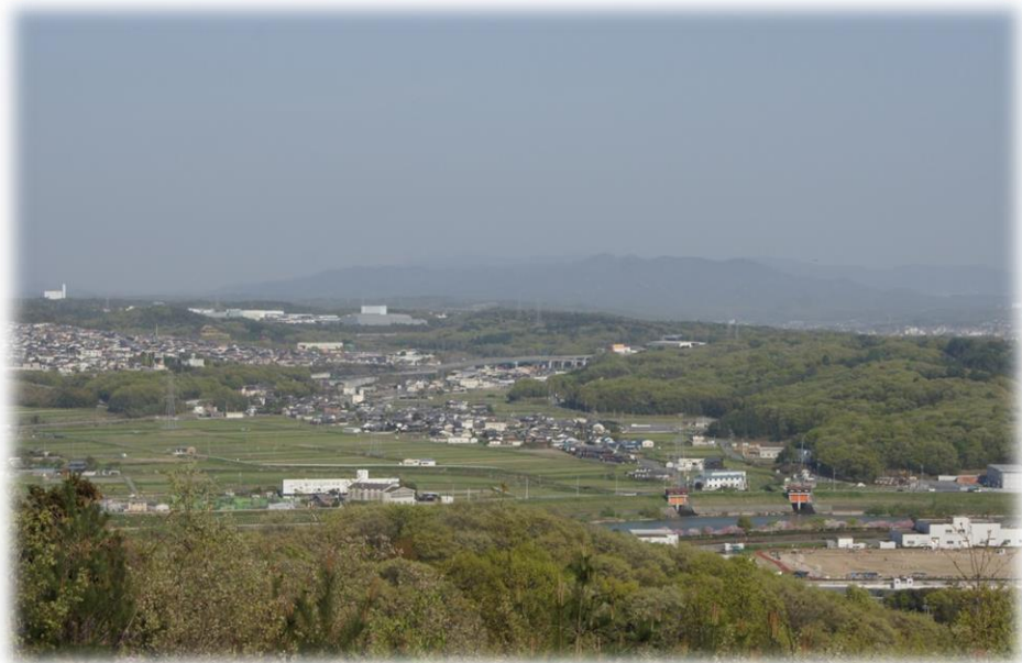
小野市白雲谷温泉 ゆぴか