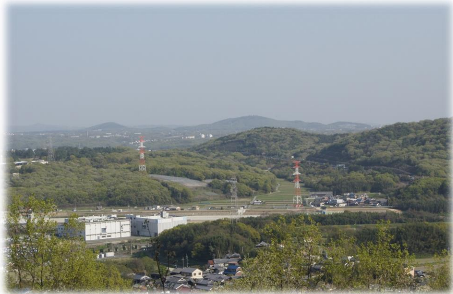
小野市白雲谷温泉 ゆぴか から 小野アルプスへ