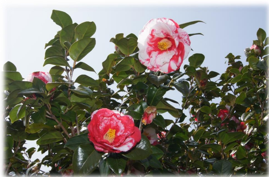
神戸市西区 雌岡山梅林