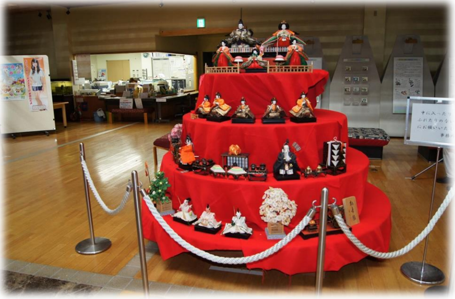
志染町公民館 文化祭