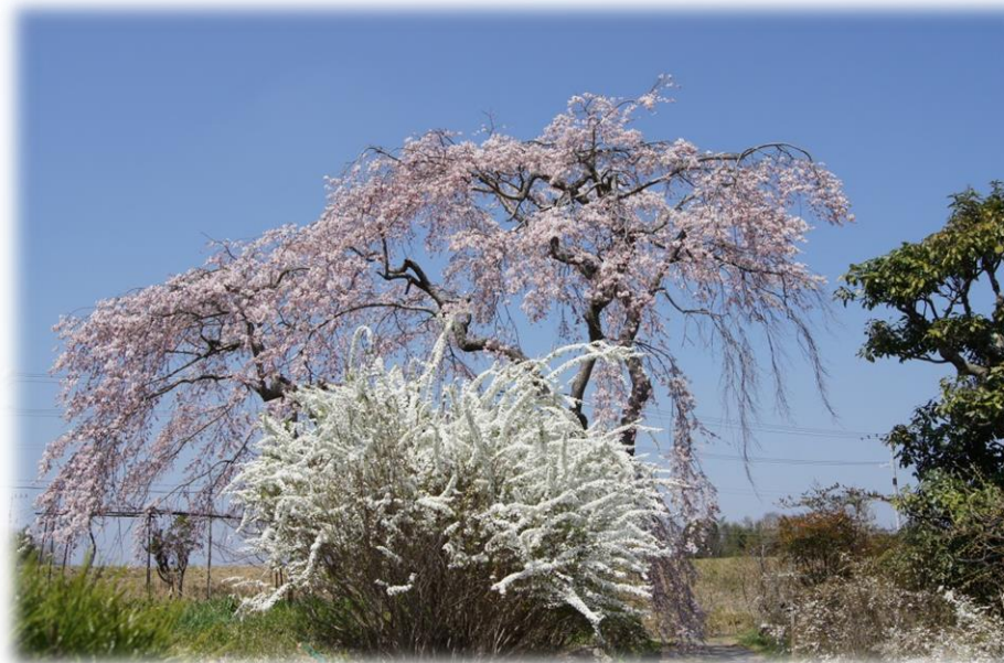
三木市志染町 御坂の枝垂れ桜