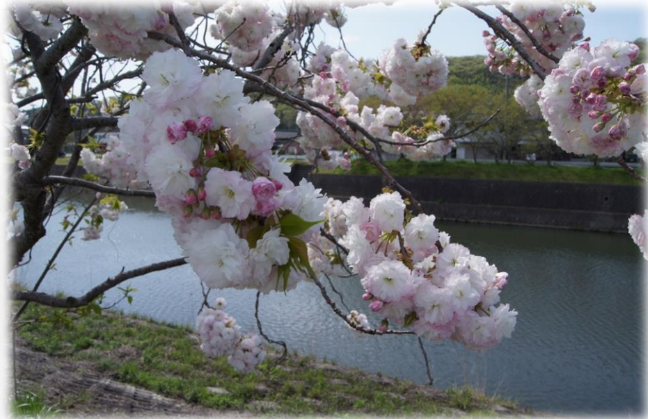
今年も東条川川沿いを歩いた