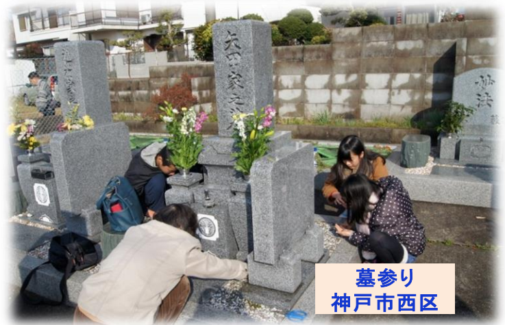
墓参り 神戸市西区