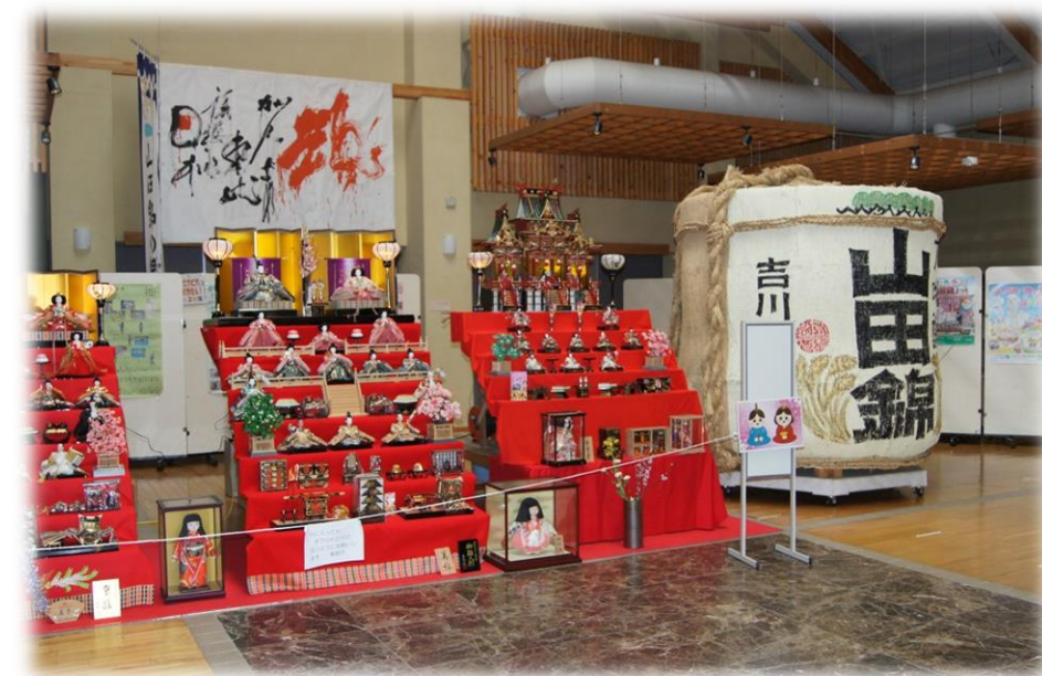
三木市 吉川町 山田錦の郷