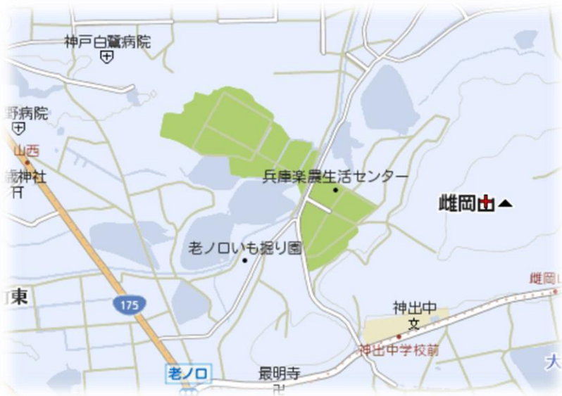
兵庫楽農生活センター