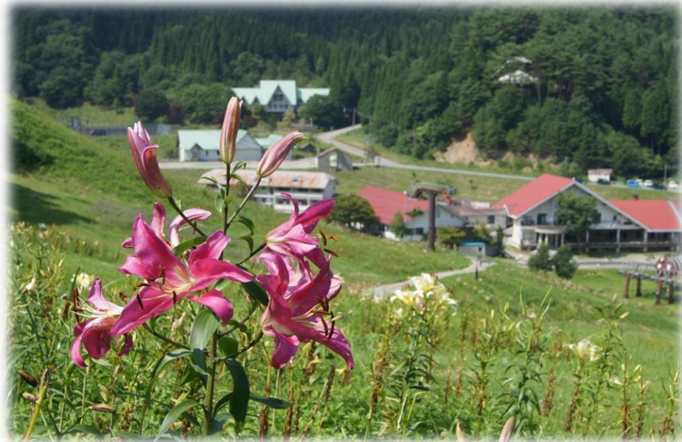
ちくさ高原 ゆり園