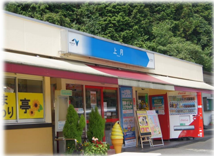
その他 の 写真