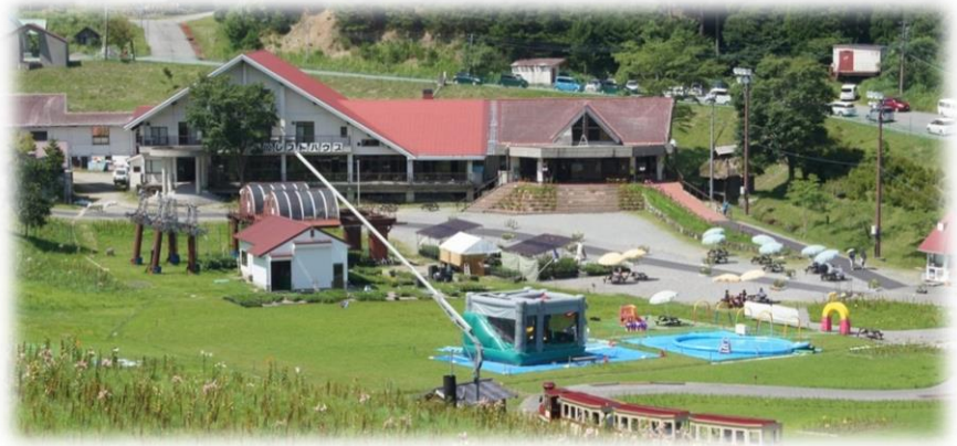
ちくさ高原 ゆり園