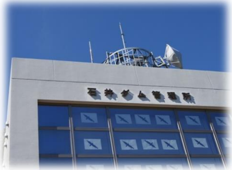
石井ダム管理センター