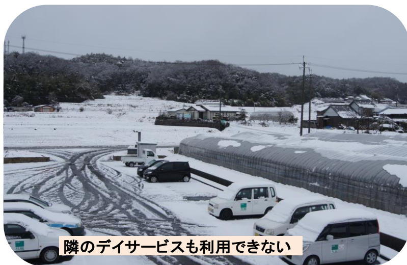
隣のデイサービスも利用できない