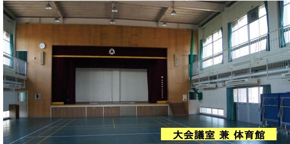
大会議室 兼 体育館