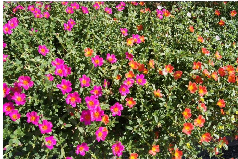
外回り(駐車場、花壇、通路等)